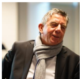
COMMUNIQUE DE MICHEL LEPRETRE, président de l'établissement public territorial Grand-Orly Seine Bièvre