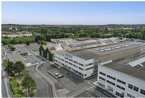
Site Renault - Choisy-le-Roi