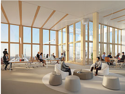
Projet Green Oak - Arcueil © M00TZ - Pelé Architectes

Dans le pôle tertiaire de la Vache Noire et adressé sur l'axe majeur de l'avenue Aristide Briand (ex-nationale 20), à 10 minutes à pied du RER B et du métro (horizon 2021), Green Oak est un bâtiment neuf développant plus de 10 000 m 2 de bureaux.