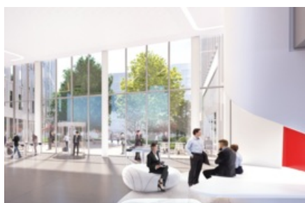
Projet Osmose - Arcueil © Arte Charpentier Architectes

Située aux portes de Paris, l'opération d'aménagement du Chaperon Vert a été développée pour désenclaver le quartier, diversifier ses fonctions urbaines, offrir davantage d'équipements publics et rénover l'habitat en vue d'améliorer la qualité de vie des habitants.