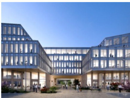
Projet Aqueduc - Gentilly

Le projet Aqueduc est un ensemble immobilier tertiaire porteur d'une image innovante. Il met en oeuvre le bien-être au travail et les nouveaux modes de travail.