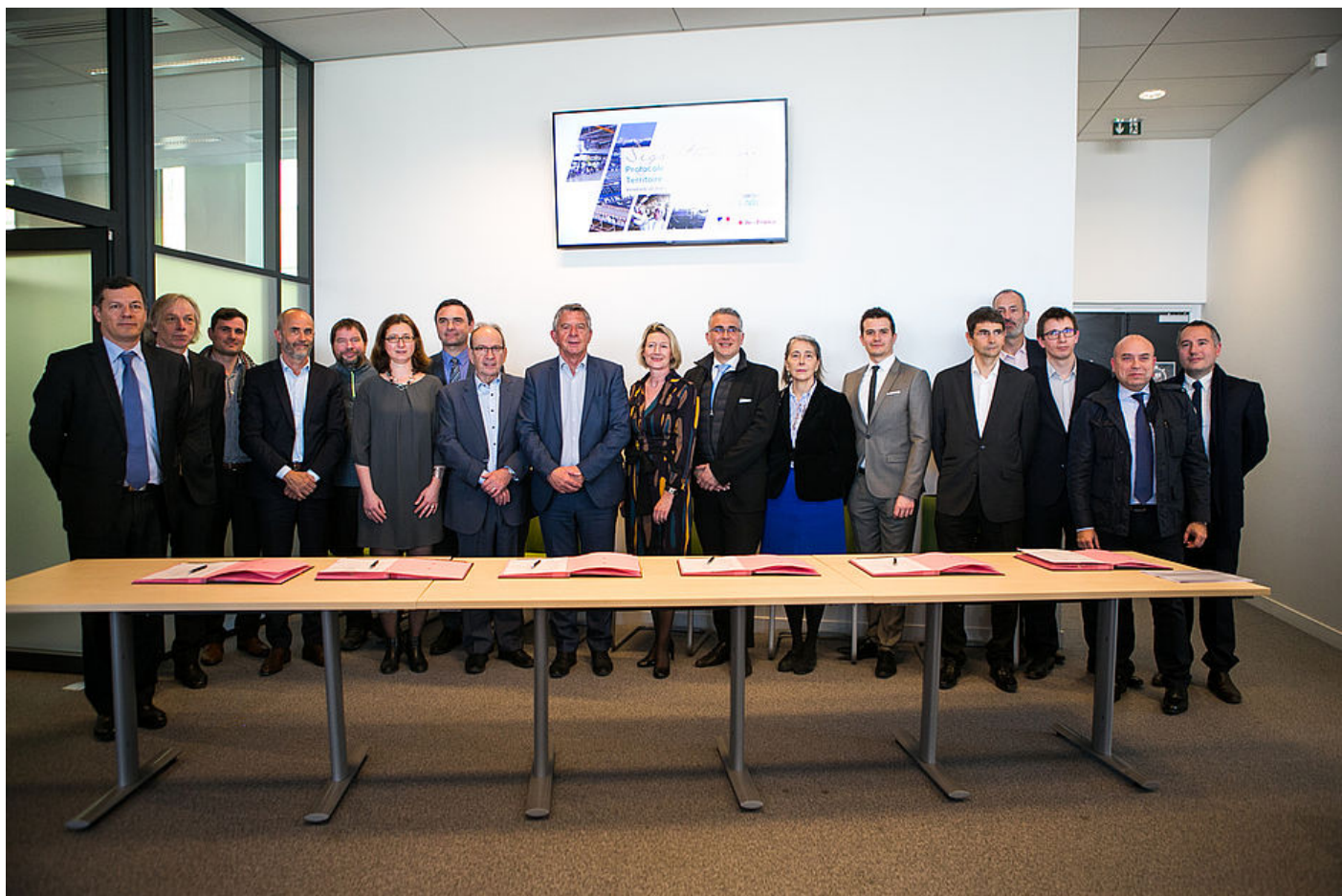
Territoire d'industrie, signature du protocole d'accord - 22 mars 2019