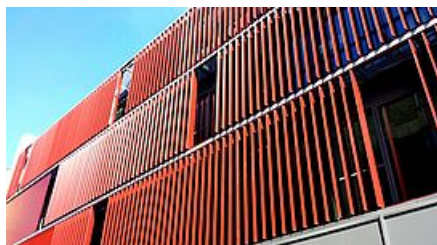
Silver Innov - Ivry-sur-Seine

Plus d'une quarantaine sont dénombrés sur le territoire du Grand-Orly Seine Bièvre , parmi lesquels :